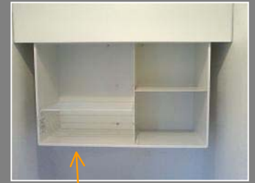
昇降ウォール収納を設置しました。