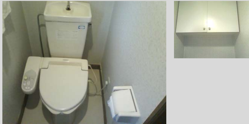
<写真の説明> ウォシュレットはそで付きタイプでした