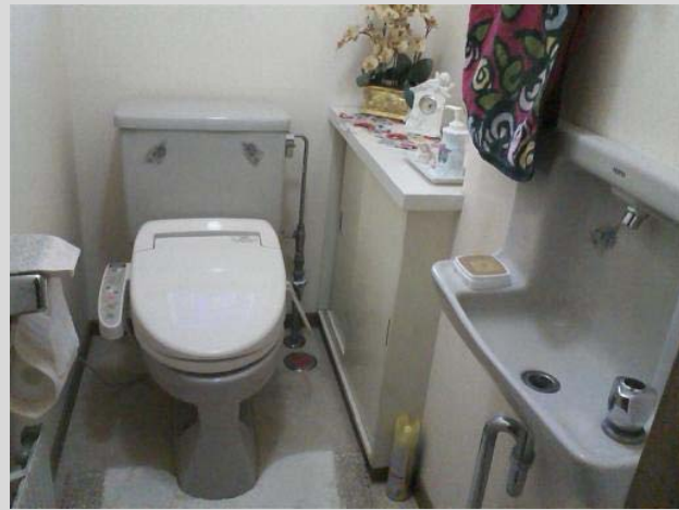
<写真の説明> ウォシュレットはそで付きタイプでした