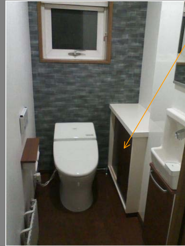
既設の戸棚の意匠をリメイクしました。