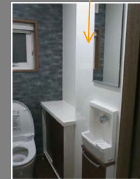
<写真の説明> ローシルエット便器「GG」・半埋込タイプ手洗器・ハイドロセラフロアを採用