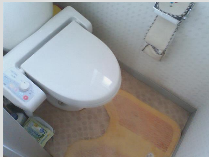
<写真の説明> ウォッシュレットの操作部が気になります。