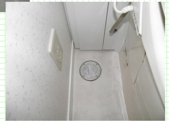
<写真の説明> レストパルを採用。タンク部分には収納場所があり掃除用具などを仕舞うことができスッキリ。寒い地方必須の水抜栓もフロアハンドルにしてスッキリ。