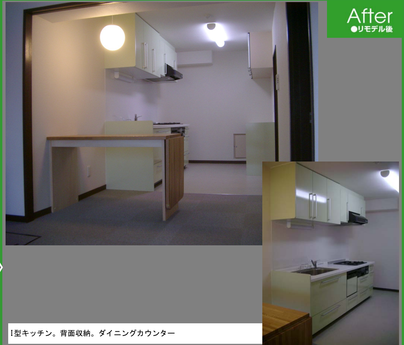
I型キッチン。背面収納。ダイニングカウンター