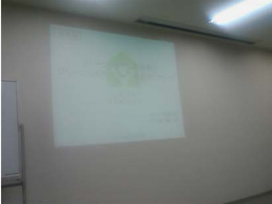
ゾーン別グリーン診断セミナー

A:スキルアップ講習:グリーン診断システムセミナー B:CS(顧客満足度UP)事例 DVD鑑賞 お客様満足向上の為に日々がんばっています。