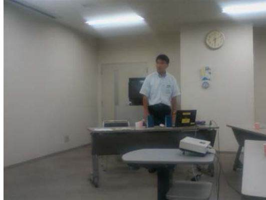
ゾーン別グリーン診断セミナー開催状況