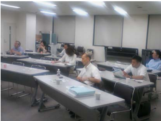
ゾーン別グリーン診断セミナー開催状況