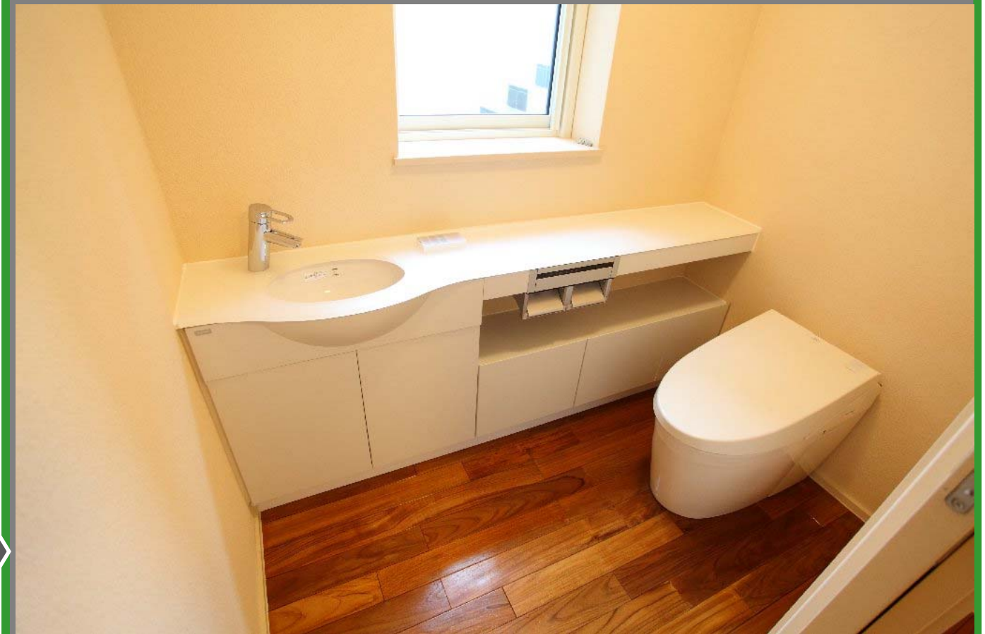
<写真の説明> 専用空間となったトイレのネオレストと手洗い器