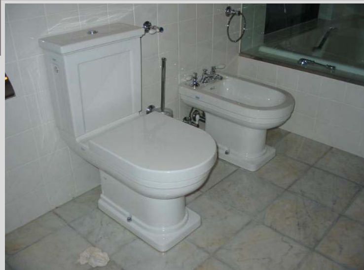
<写真の説明> バスルームに設置された便器とビデ